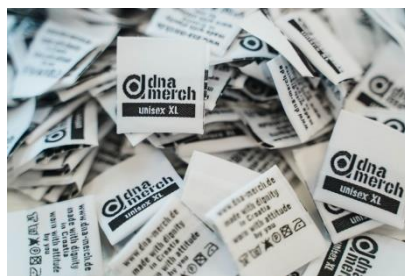
Gewebte Etikette | woven label