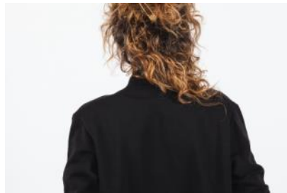
Marina - Größe | size XS