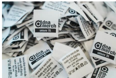
Gewebte Etikette | woven label